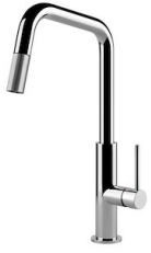
Miscelatore KS Plus 8522 000