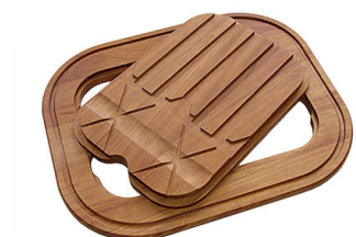
Tagliere Twin in legno Iroko 8644 003