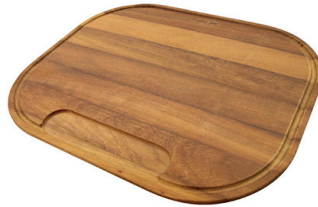
Tagliere in legno Iroko 8659 112